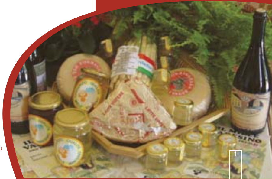
Foto: 1. Prodotti tipici

The territory's singular conformation, offering panoramas of incomparable beauty , is also reflected in the Varese gastronomy and in its typical products: cheeses, cold cuts, wine and honey are but a few of the delicacies of this province, products that to this day are prepared in true artisan style according to age old traditions. Skilled restaurateurs are able to prepare tasty dishes typical of the Varese land, reviving traditional recipes of the Lombard cuisine, based on rice, fish from the lakes, venison and polenta (corn meal). Following our suggestions, we invite you to discover the flavours, places and the typical products that the Varese province is able to offer.