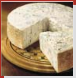
Foto: 17.-18. Gorgonzola D.O.P. 19. Il lago di Varese